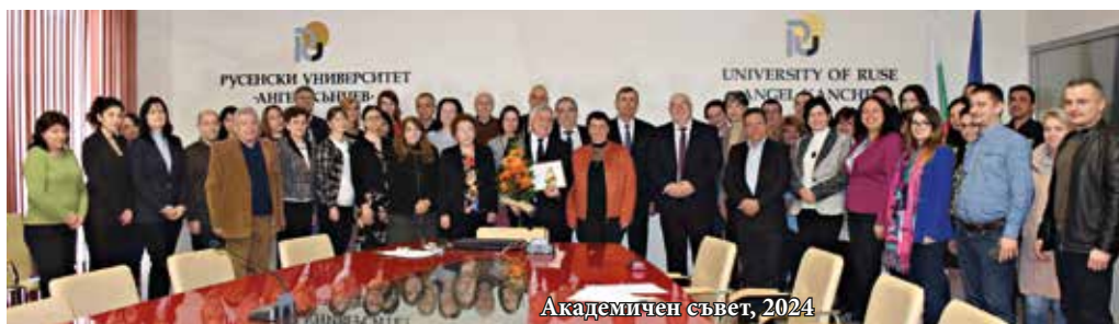
Академичен съвет, 2024