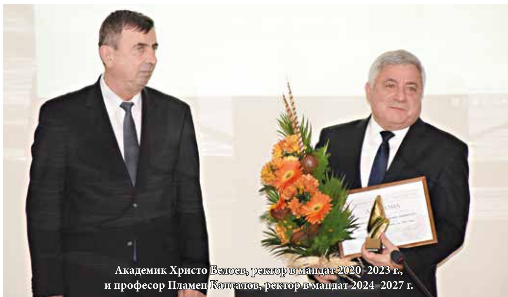
Академик Христо Белоев, ректор в мандат 2020–2023 г., и професор Пламен Кангалов, ректор в мандат 2024–2027 г.

Акад. Белоев е отличаван многократно за научна, научно-приложна, преподавателска и публична дейност. Удостоен е от Президента на Република България и Министерски съвет с орден „Св. св. Кирил и Методий“ – първа степен през 2016 г. за големи заслуги в областта на образованието и науката. Той е Доктор хонорис кауза на 18 университета от Европа и Азия. Носител е на награда за наука „Питагор“ за 2013 г.