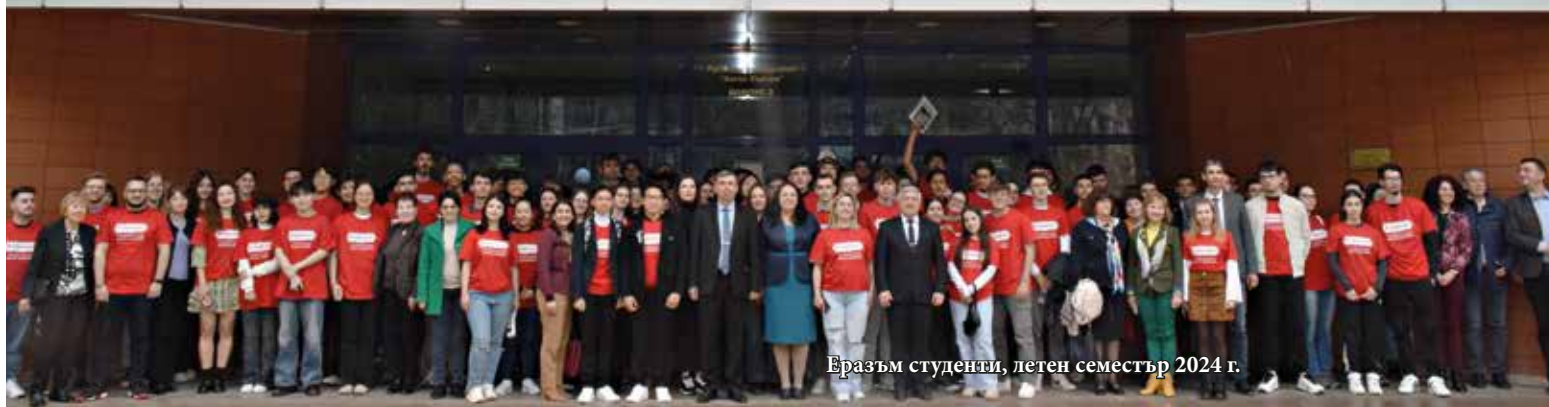
Еразъм студенти, летен семестър 2024 г.