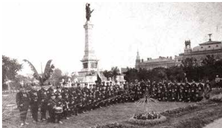
СПОМЕНЪТ ПО СЛУЧАЙ ОСВЕЩЕНИЕТО ПАМЯТНИКА, 11 АВГУСТЪТ 1908 ГОД.